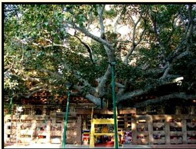
Strom Sri Maha Bodhi na Srí Lance.